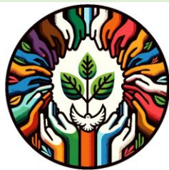
Las primicias de la esperanza (cf. Rom 8:19-25)